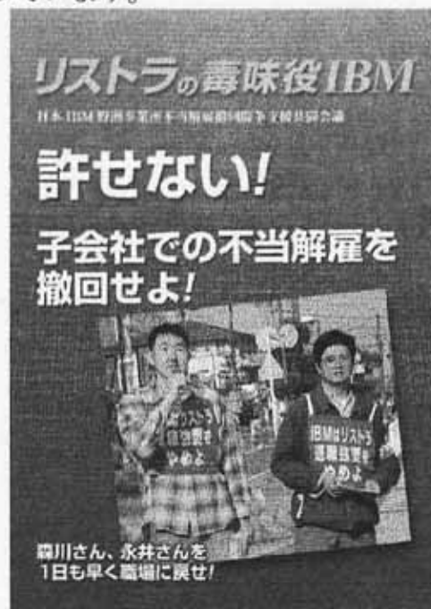
共闘パンフレット表紙

>このパンフは働く機会に挑戦し続けた労働者が、IBMの子会社で世界一の液晶ディスプレイづくりの最中、突然の会社清算、団体交渉中に解雇通知を読み上げるという不当解雇を経験、「もう、黙ってられない。」と、そのたたかひの経過を綴っています。